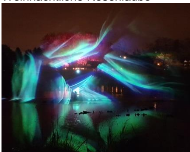
Über dem Amerikasee flackert das Polarlicht auf einer Nebelwand